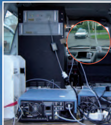
Véhicule équipé de capteurs de particules fines et d'analyseurs de gaz