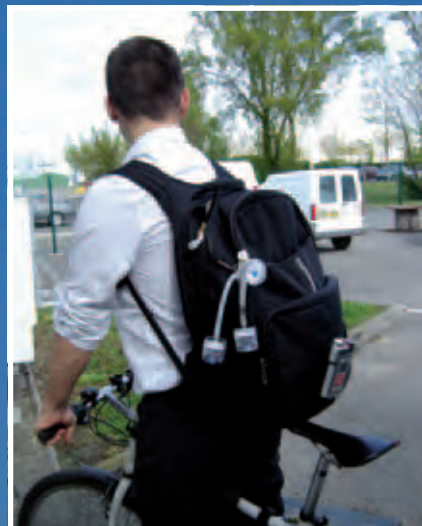
Cycliste équipé de capteurs de particules fines

C'est dans sa voiture qu'on respire le plus de pollution !