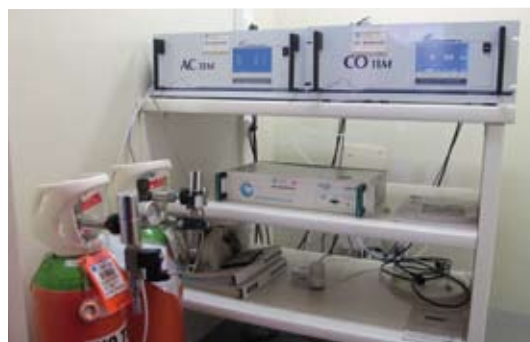
Station de qualité de l'air de la rue Pargaminières à Toulouse