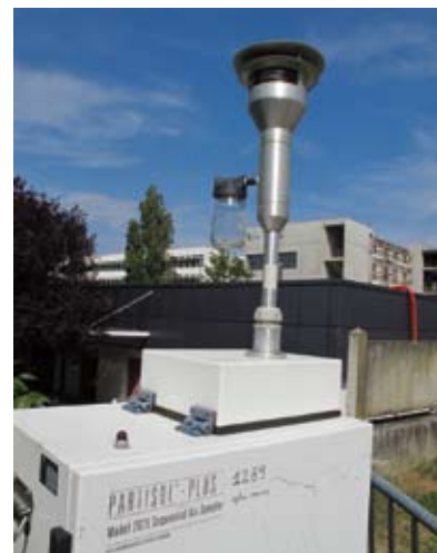
Préleveur pour métaux, station Berthelot à Toulouse