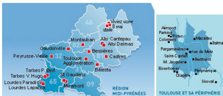
Les stations fixes de l'ORAMIP en 2010