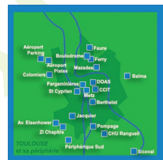
Stations fixes réparties sur l'agglomération toulousaine.