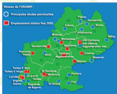
L'ORAMIP surveille la qualité de l'air dans les huit départements de la région Midi-Pyrénées.

Consultez dès maintenant et en temps réel les mesures des stations de l'aéroport sur la borne Internet d'AéropIace, thème de l'air, site de l'ORAMIP.